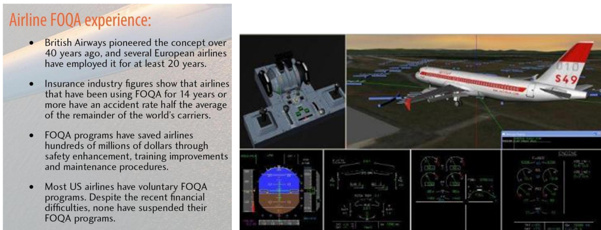
Figure 2. FOQA experience of airline

이터 기록장치(FDVR: Flight Video Data Recorder) 등이 있다. 군용 항공분야에서의 FOQA 적용은 임무준비태세와 비행안전의 향상 및 운영 비용절감 등의 효과를 가져왔다. 미 해군 사례를 살펴보면, FOQA 도입 이후 예산 절감액이 연간 $40,000,000가 넘을 것으로 추정하고 있다(US NAVY, 2003). 한국 공군의 경우, 전투기나 훈련기에서 FOQA라는 개념으로 운영하지는 않지만, FDR, CVR, FDVR을 이용하여, 비행자료를 안전측면에서 관리한다. 실제로 매 비행시 비행 전 과정이 녹음되도록 하며, 주요결함, 비행규정 위반 및 사고·사태 발생시 관련 정보를 분석한다. 비행 후에 임무분석을 위해서 CVR, FDVR 등을 활용하며, 조종사의 비행능력, 규정절차 준수 상태를 점검한다. 민간항공기와 동일한 일부 공중기동기에서는 FOQA 시스템을 운영하고 있다.